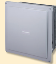
② パワーコンディショナ