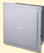
② パワーコンディショナ